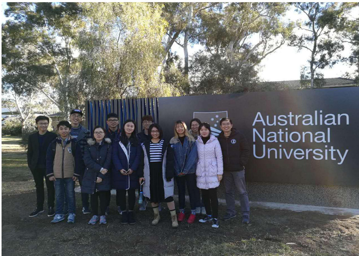
澳大利亚国立大学

6. 邦迪海滩：邦迪海滩约长一公里，曾是几部澳大利亚或国际电影和电视剧的拍摄场地，每年都是很多观光客必到之处。在这里，阳光灿烂，微风清凉，你可以感受到蓝天碧海以及澳洲美丽的阳光沙滩。