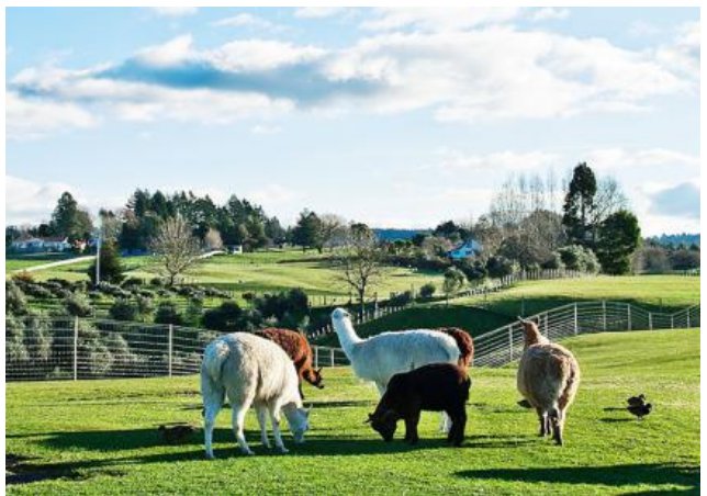
悉尼歌剧院、蓝山、邦迪海滩、澳大利亚当地农场