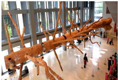
西雅图艺术博物馆