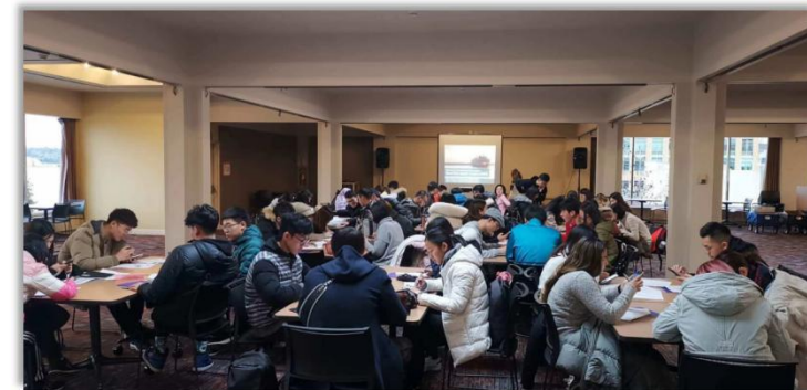
等待英语水平测试