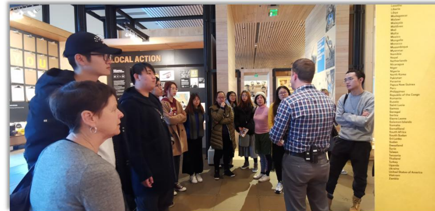
参观比尔盖茨和梅琳达基金会