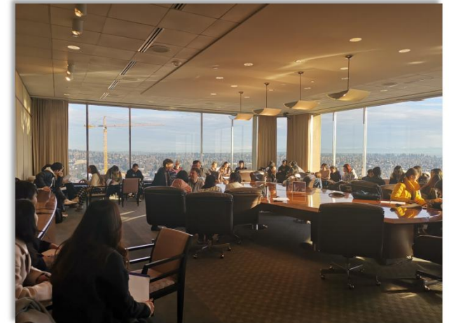
和在校生一同交流