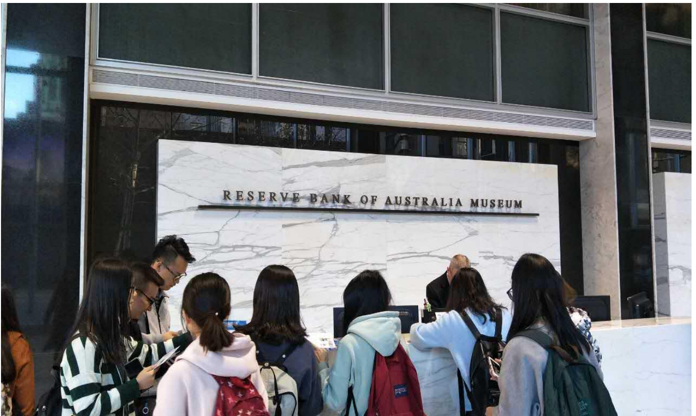
参观澳大利亚储备银行