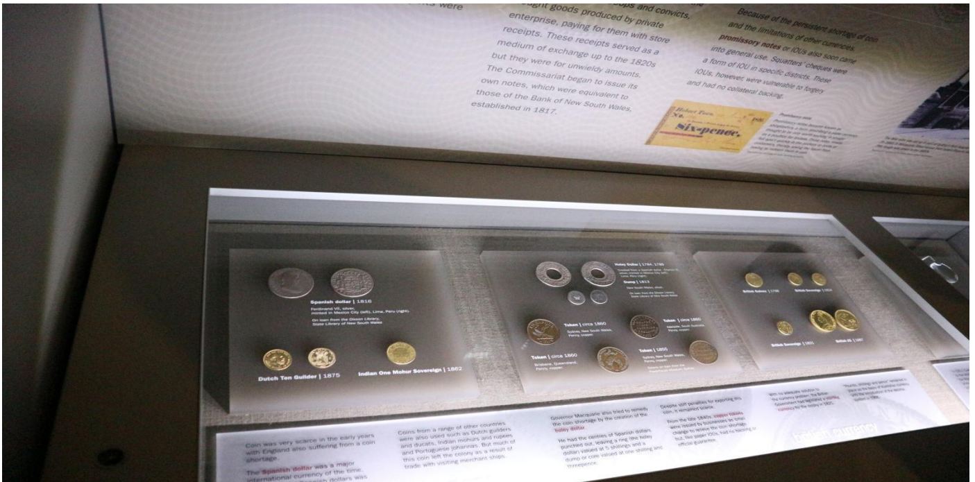
澳大利亚储备银行货币展览