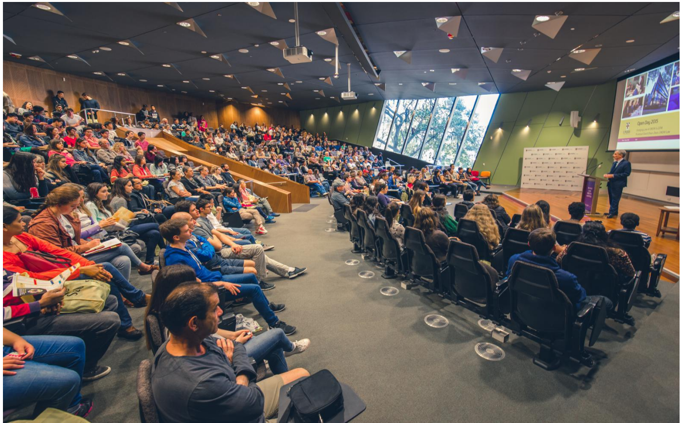
新南威尔士大学开放日