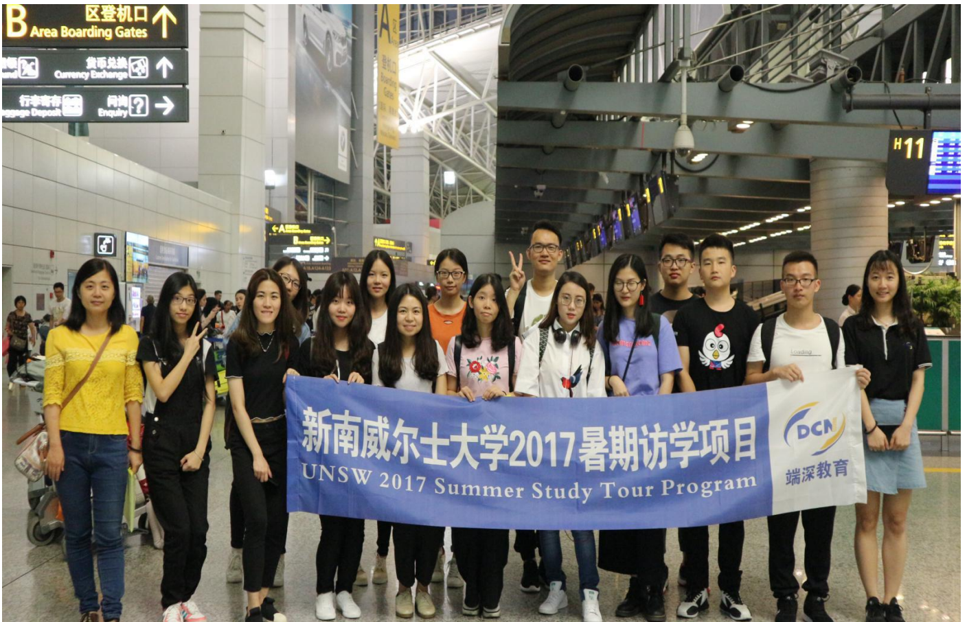
2017 暑期访学学生合影