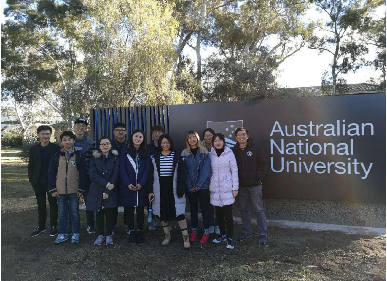
澳大利亚国立大学

6. 邦迪海滩：邦迪海滩约长一公里，曾是几部澳大利亚或国际电影和电视剧的拍摄场地，每年都是很多观光客必到之处。在这里，阳光灿烂，微风清凉，你可以感受到蓝天碧海以及澳洲美丽的阳光沙滩。